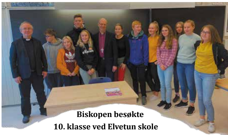
Biskopen besøkte 10. klasse ved Elvetun skole

Det er vanlig at en bispevisitas prioriterer skolebesøk. Det gjorde også biskop Olav Øygard i Dyrøy. Biskopen med følge møtte elevene i 10. klasse ved Elvetun skole.