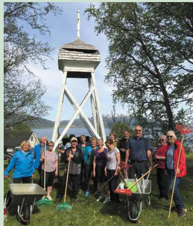
I vår var det dugnad ved den nedlagte kirkegården i Kastneshamn. Og som bildet viser er det ingenting å si på oppmøtet. Tårnet ser ut til å trenge litt vedlikehold for klokken i tårnet ramler ned. Siste begravelse på Kastnes var i 1998.