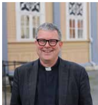
Menighetsbladet for Dyrøy Nr. 1 - 2026