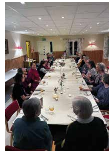
25 kreative damer må også ha mat, og da snakker vi ikke matpakke.