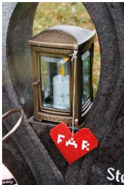
Ill.foto Brøstad gravlund