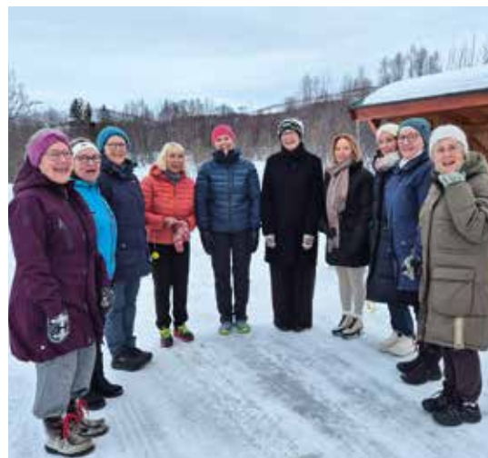
En luftetur klarer hjernen.

Videre ble det strikkesett, malt, sunget, luftetur og pusteøvelser gjennomført, skravlet rundt bordene over kaffekoppen og nye bekjentskap etablert. Enhver gjorde det som passet for dem i en avstresset atmosfære.