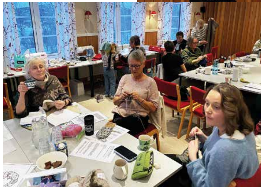
Et strikkesett, sjokolade, en kaffekopp, - hvem blir ikke inspirert av det?