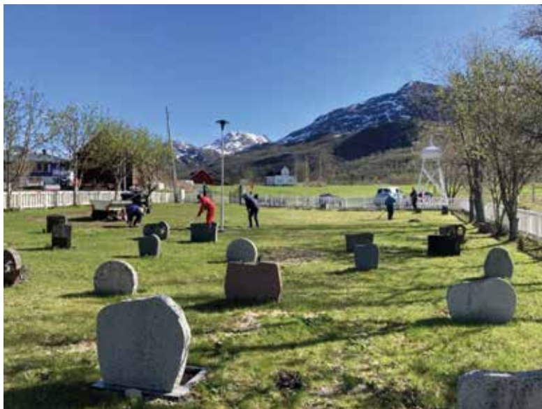
Bildet er fra dugnad på Faksfjord gravlund, 22. mai i år.