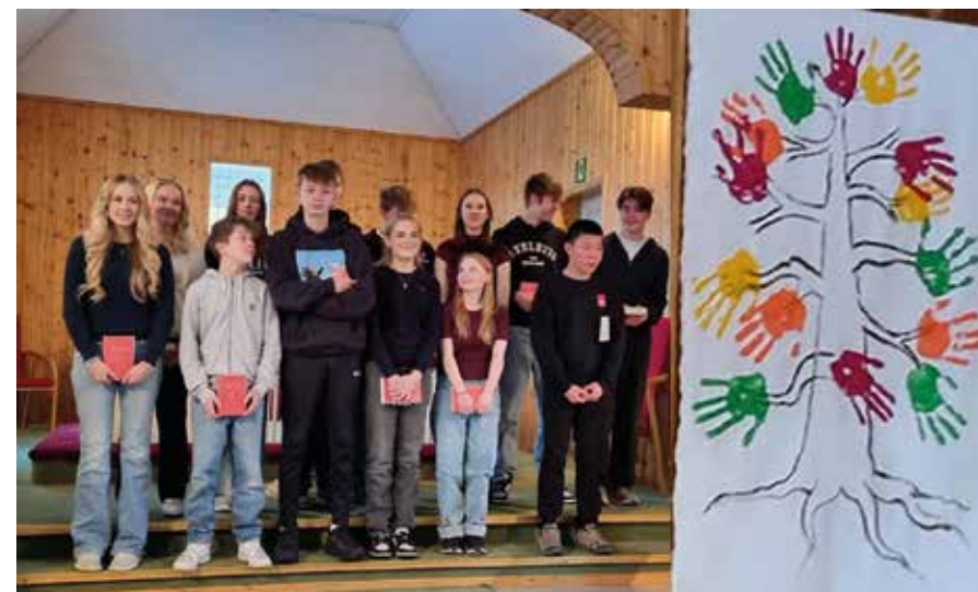
Fra presentasjonsgudstjenesten i november satte konfirmanterne sitt avtrykk på bildet for å illustrere viktigheten av samarbeid og samhold.

Med vennlig hilsen Kjell-Sverre Myrvoll Ordfører og far til en konfirmant