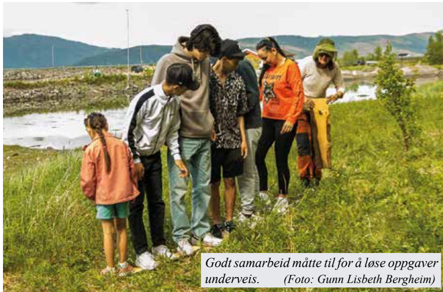
Godt samarbeid måtte til for å løse oppgaver underveis.

«Vi tror at det å gå på tur sammen og dele et felles måltid kan bidra til et varmere samfunn».