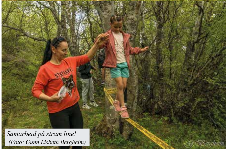
Samarbeid på stram line!