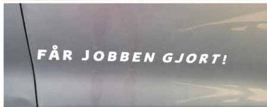
Ingen dugnad uten vafler, - da er det mye lettere å få jobben gjort!